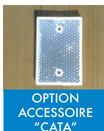
OPTION ACCESSOIRE "CATA"