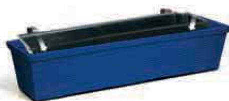
P-FIX-GALB pour fixation balconnière suspendue ou galbée

Les fixations sont identiques pour les balconnières suspendues et galbées (réf. FIX BAL). Possibilité d'étriers pour rambarde : largeurs 40, 50, 70, 90, 110 et 125 mm.