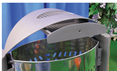
Tiroir cendrier coulissant (en option)