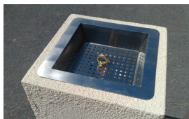
OPTION : FILTRE INOX