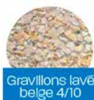
Gravillons lavé belge 4/10