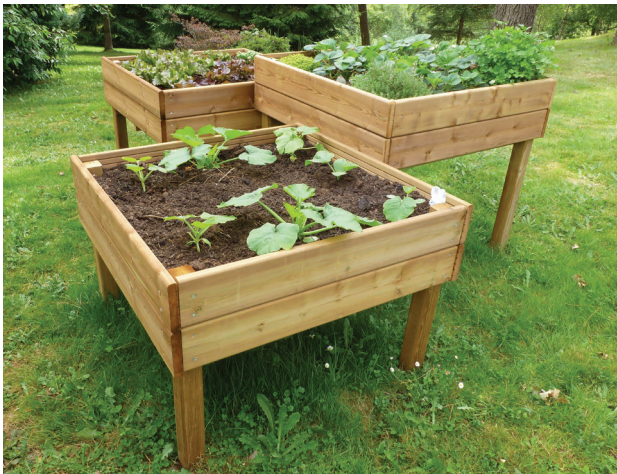
EXEMPLE DE 3 TABLES POTAGÈRES POSÉES EN DÉCALÉ AVEC 3 HAUTEURS DIFFÉRENTES 1 M - 0,85 M - 0,70 M

Dimensions : L. 1000 x l. 1000 x H. 1000 mm.