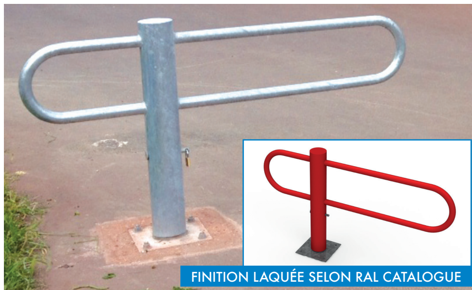
FINITION LAQUÉE SELON RAL CATALOGUE