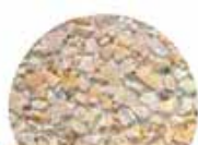
Gravillons lavé belge 4/10